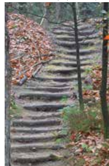
Van de pomp naar boven 7 meter

aangekomen. Gelukkig had ik wel een telefoonnummer bij me van de kampmeester.