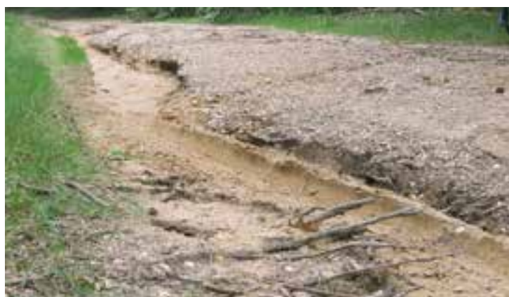
Het stroomt nog steeds weg

Zo’n klein smeltwaterdal is onze Kooiberg. Ons dal is 7 meter diep, dat is het hoogteverschil tussen het voormalig pomphuisje boven en de huidige pomp beneden. Ons dal loopt vrijwel van noord naar zuid. Het wordt geblokkeerd door de A1, maar even daarna buigt het af naar het oosten.